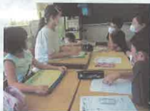
なかよし遠足のめあてづくり

当日は、上越教育大学の教育実習生に加え、8名の学び・ささえ隊の皆様にもご協力いただきながらの遠足でした。ご協力に深く感謝いたします。ありがとうございました。