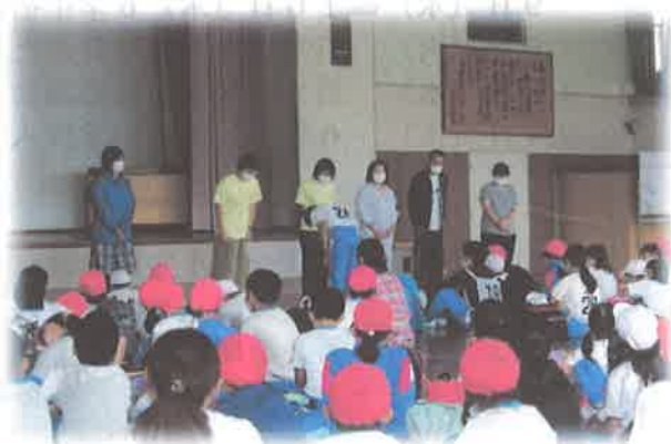
学び・ささえ隊の皆さん、ありがとう！！