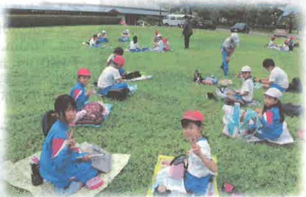
各班でおいしいお昼ごはんを食べたよ