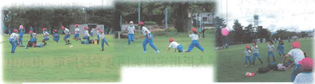
高田城址公園にて遊びタイム～大縄飛び・だるまさんが転んだ・風船バレー～