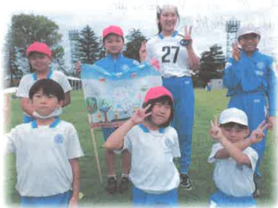
みんなで歩き切って、記念撮影