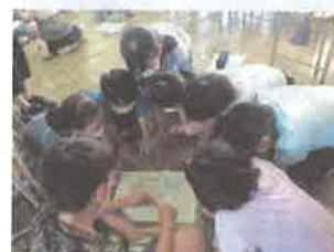
ルートをみんなで決めよう!