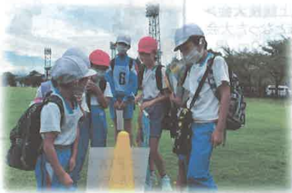
クイズポイントで思案中