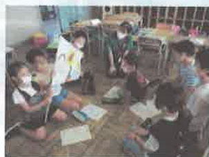
オリジナルフラッグ完成!