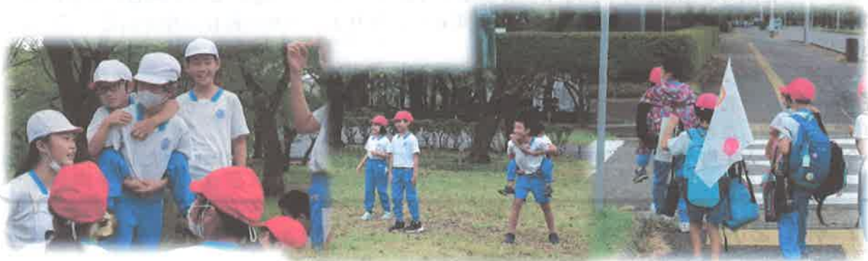
なかよし班で優しさを発揮するリーダー達