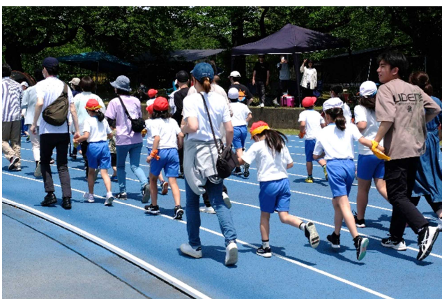
ラン・ラン・ラン